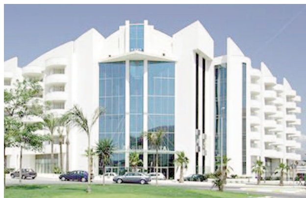
Hotel Albir Playa